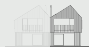
Pohled ze zahrady