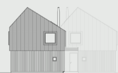
Pohled z ulice